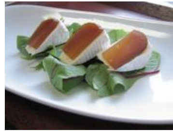
カマンベール柚餅子