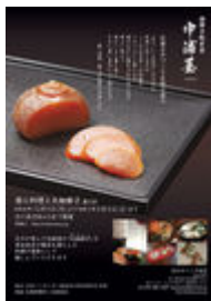
イベントフライヤー